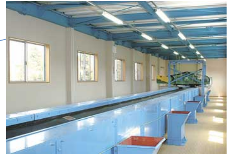
手選別コンベアー