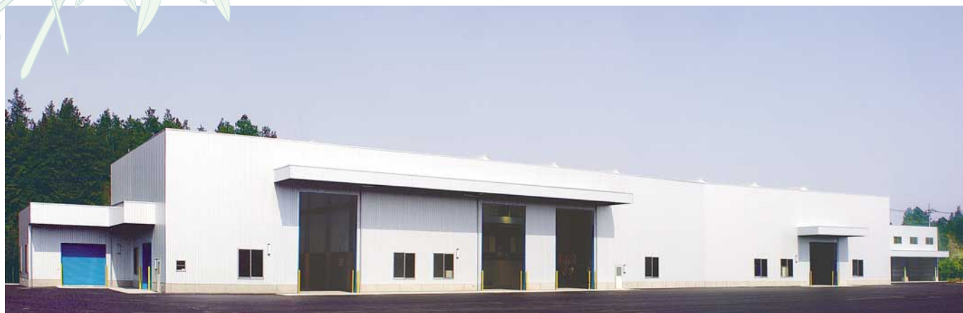
オリーブリーフ.L 中間処理施設

~peace&abundance for the future for the children~