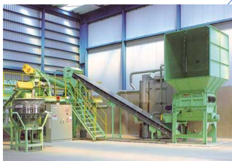
石膏ボード粉碎機