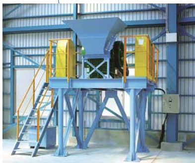
コンクリートクラッシャー