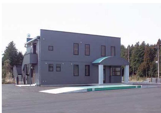
事務所/トラックスケール